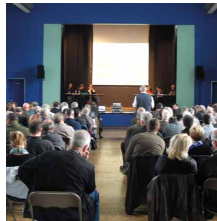
Comité de pilotage du 5 novembre 2014