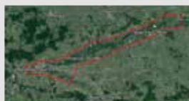
Secteur du levé LIDAR

Les deux maîtres d'ouvrage ont pu exposer l'avancement respectif de leur projet et ont ainsi défini les modalités de leur coordination à travers la présentation d'une charte commune. En 2015, l'acquisition de données topographiques par la technique du LIDAR (survol aérien avec un laser) a été utilisée pour construire en commun un modèle numérique de terrain de l'ensemble de la plaine alluviale de la Bassée.