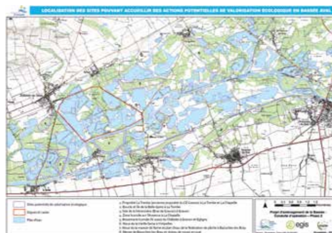
Sites potentiels pour la valorisation écologique