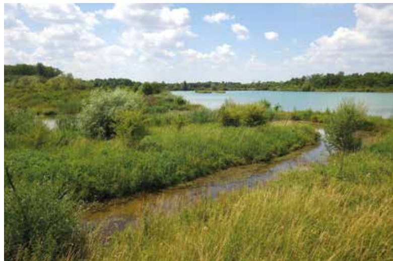
Habitat humide dans le « casier » 7+8