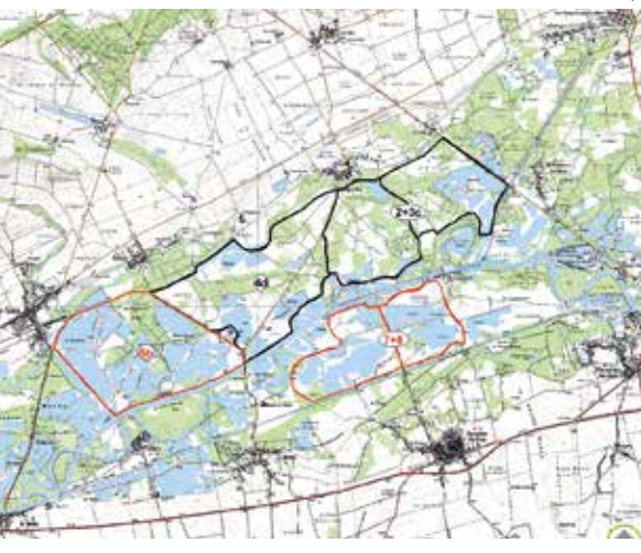
Carte des scénarios sur lesquels a été réalisée l'analyse multicritères.

Enfin, une réunion publique viendra clôturer cette phase de concertation en fin d'année 2014. ■