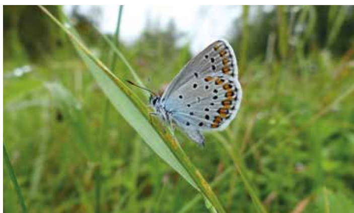
↑ Azuré des Cornilles

Avant de procéder au choix définitif du site pilote de la Bassée, une mise à jour des données écologiques sur les deux scénarios les plus favorables (5b et 7+8) a été décidée par l'EPTB Seine Grands Lacs à la demande des services de l'État. Une campagne d'inventaires faune-flore s'est déroulée de mai à fin août. L'ensemble des données récoltées complètera le volet écologique de l'analyse multicritères et permettra de définir le scénario de moindre impact écologique. Ces données seront rendues publiques sur la page Internet Bassée http://www.seinegrandslacs.fr/actualites-gls/actualite-la-bassee au cours du second semestre 2014.